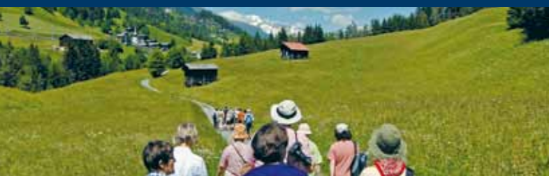
Das Vernissagepublikum auf dem Weg von Steinhaus nach Niederwald.