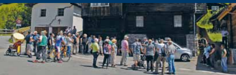
Vernissagepublikum auf dem Dorfplatz von Steinhaus.