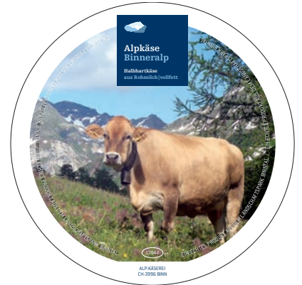
Beispiel einer Etikette für Produkte mit dem Herkunftslabel des Landschaftsparks Binntal.

Anmeldung bis Dienstag, 25. Mai 2010, Tel. 027 971 50 50, info@landschaftspark-binntal.ch