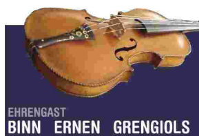
EHRENGAST BINN ERNEN GRENGIOLS