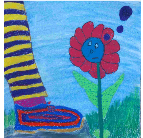
Kinder zeigen und zeichnen, wie man sich im Park respektvoll bewegt

Im vergangenen Frühling haben die Kinder der Primarschulen von Binn, Ernen und Grenchols auf Einladung des Landschaftsparks hin zahlreiche farbige Zeichnungen angefertigt mit Verhaltenstipps für Gäste und Einheimische. Was können wir tun, um unsere wunderschöne Natur zu geniessen, ohne der Umwelt zu schaden? Die Tipps der Kinder sind ebenso bunt wie vielfältig ausgefallen und laden zu einem respektvollen Umgang mit Natur und